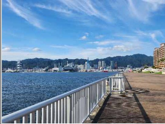
<숙소 근처 바다>