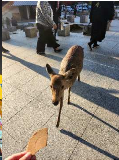
<간사이 지역 관광>