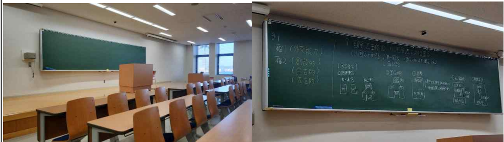
<전공 강의실과 판서>

- 제가 교환학생을 결정한 목적이자 가장 기대하고 있던 것이 바로 전공 수업이었습니다. 한자를 읽는 건 우리가 있지만 해석하는 건 어느 정도 자신이 있었기 때문에 해석하는 데 큰 무리가 없으리라 생각했습니다. 물론 이것만으로는 현지 학생들처럼 완벽하게 이해하고 습득할 수 있을 것이라는 생각을 하지 않았지만, 상상 이상으로 말이 빠르고 용어들은 복잡했습니다. 이해할 수 있는 말들은 전체의 60%밖에 되지 않았으며 그마저도 열심히 공부하는 현지 학생들을 따라가기에는 조금 벅차다는 생각도 들었습니다. 그렇게 한계를 느끼고 절망만 하다가 잠시 공부를 놔둔 시기도 존재했습니다만 나눠주신 수업 자료를 미리 예습하거나 복습으로 모르는 단어들을 적립해 나가며 저의 부족한 부분을 조금씩 메꿔갔습니다. 가장 인상 깊었고 기억에 남는 순간은 전공 시간에 발표했던 것이었습니다. 일본에서 재판관으로 일하시는 외부 강사님께서 소년법에 대하여 강의하던 도중 저를 지목해 발표를 시키는 일이 있었습니다. 원래는 강의식 수업이 원칙이고 그마저도 제가 외국인인 걸 아는 교수님들은 저에게 발표를 시키지 않으셨지만, 강사님께서 그걸 몰랐기에 절 지목한 것이었습니다. 제가 외국인인 걸 모르는 자리에서 발표하는 것이 처음이라 도중 많이 긴장했지만 끝나치고 나서는 성취감과 뿌듯함을 얻을 수 있었습니다. 도중 모든 문답을 답변하지는 못했지만, 수업에 참여했다는 흔적을 조금이라도 남길 수 있어 가장 기억에 남는 순간이 되었습니다.